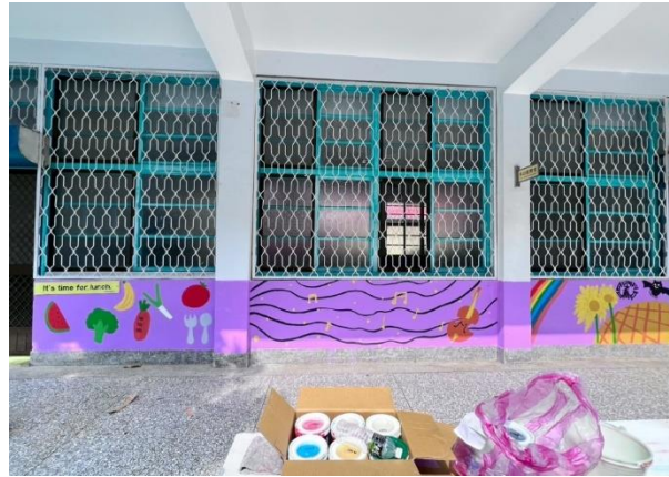
1140328 社聯會參加偏鄉學校 服務-創意彩繪